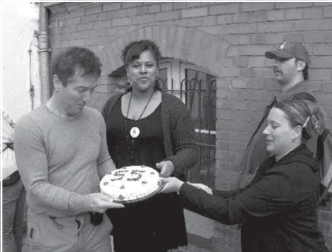
55 Jahre erfolgreiche Jugendarbeit an der Havelhöhe und das war es?

Für das nächste Jahr hatten CDU, FDP und Graue die Schließungen von vier Jugendfreizeiteinrichtungen im Bezirk geplant. Auf der Agenda der Schließungen waren die Villa Media in Hakenfelde, das Haveleck im Pulvermühlenquartier sowie die Motorwerkstätten in Hakenfelde und Wilhelmstadt. Verantwortlich für diesen jugendpolitischen Unsinn war ein gemeinsamer