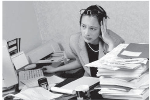
„Sei doch froh, dass Du überhaupt (noch) eine Arbeit hast!“