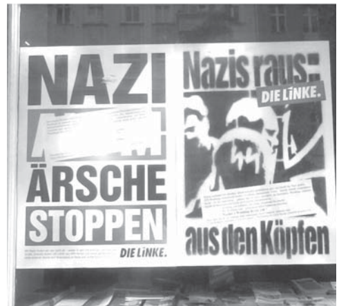
Der vierte Schmierangriff der Nazis auf den Linkstreff

Nachts kommen sie aus ihren Löchern gekrochen, natürlich nur in Horden und